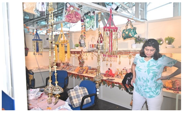
A customer looking at the products showcased

sell their products under this initiative of Ministry of Civil Aviation (Government of India) and Airport Authority of India's (AAI) new